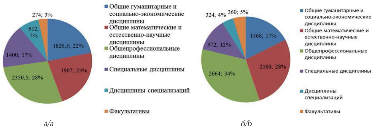
Рис. 1. Распределение общего объема работ по блокам дисциплин, часы, %: а) 2004 г.; б) 2021 г. Fig. 1. Distribution of the total amount of work by blocks of disciplines, hours, %: a) 2004; b) 2021

На рис. 2, 3 представлено перераспределение часов аудиторной и самостоятельной работы.